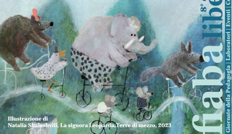
Illustrazione di Natalia Shaloshvili, La signora Leoparda, Terre di mezzo, 2023

8° edizione fiabaliberatutti! Giornate della Pedagogia | Laboratori | Eventi | Concorso | Mostra d'illustrazione