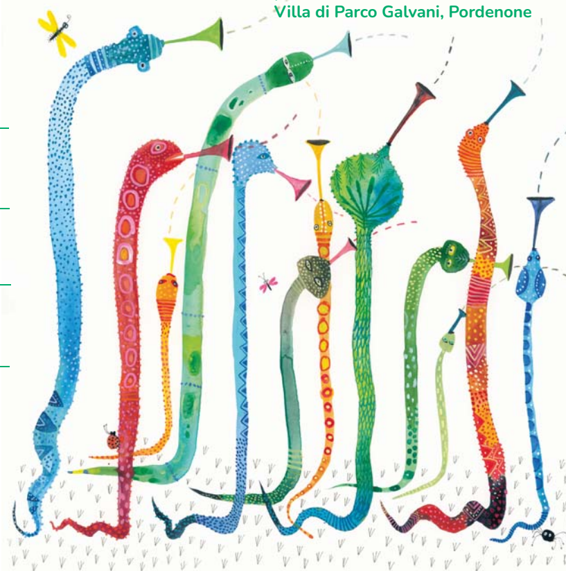
Illustrazione di Piet Grobler If pigs could swim and fish could fly, 2024)

presso Palazzo del Fumetto Villa di Parco Galvani, Pordenone